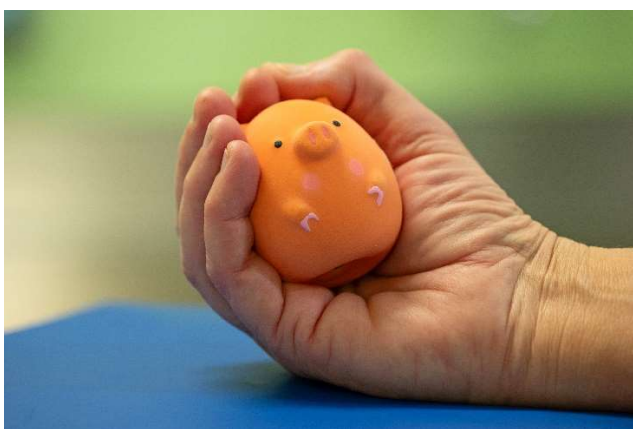
Bildtext: Quietsche Tierchen BHS Ried